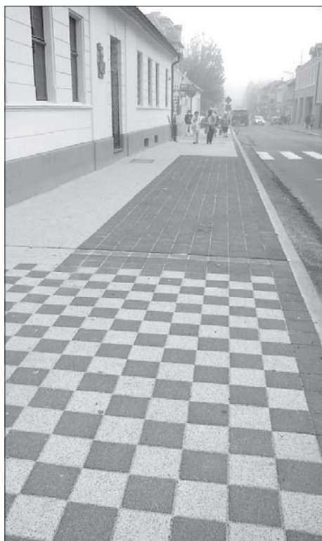
Nowy chodnik przy ul. Poznańskiej

zowaniem Miasta i Gminy Pleszew, która na ten cel przeznaczyła 30% potrzebnej sumy. Powiat wyłożył 70% potrzebnych środków.