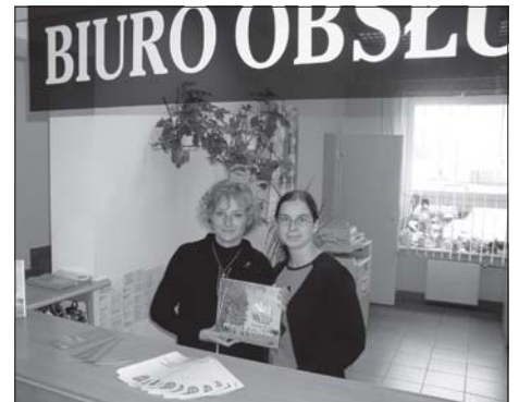
Sprzedaż albumu prowadzi Biuro Obsługi Interesanta Starostwa Powiatowego w Pleszewie. Cena wynosi 30 zł.

Kolorowy album o Powiecie Pleszewskim jest dobrym upominkiem dla gości z innych regionów Polski i gości zagranicznych, odwiedzających nasz powiat. Pierwsze akcydensowe (przed drukiem seryjnym) egzemplarze albumu Pleszewianie wręczyli Papieżowi