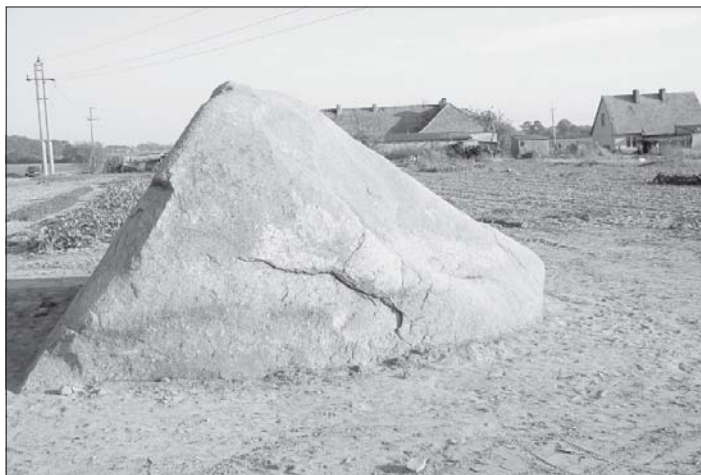
Gład narzutowy w Rudzie w gminie Dobrzyca

Honorowy patronat nad udostępnieniem zagospodaro-