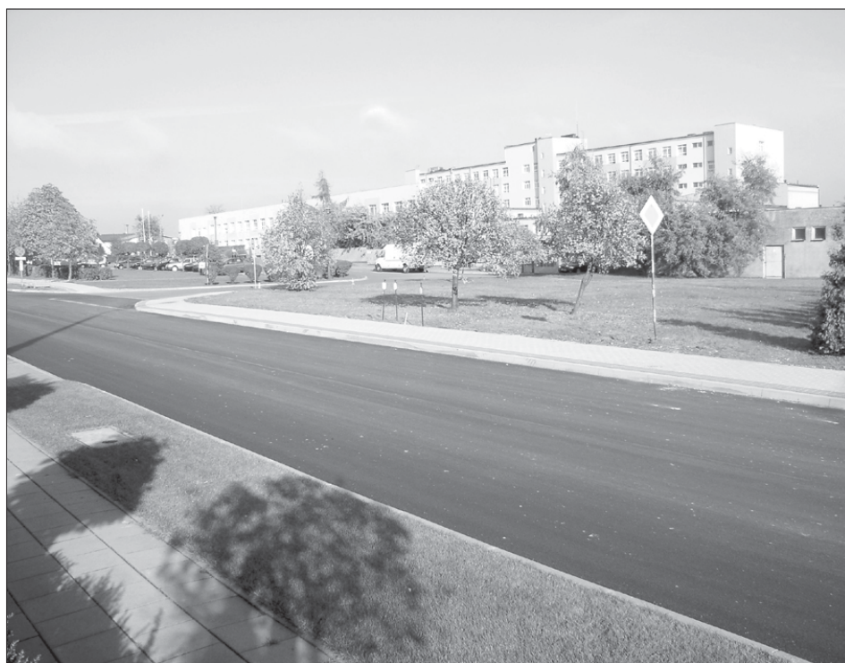
Wyremontowana ulica Szpitalna

Obecnie trwa przebudowa drogi na ulicy Szpitalnej w Pleszewie. Całkowity koszt tego zadania to 200.000 złotych. Modernizacja drogi jest możliwa dzięki zaangażowaniu