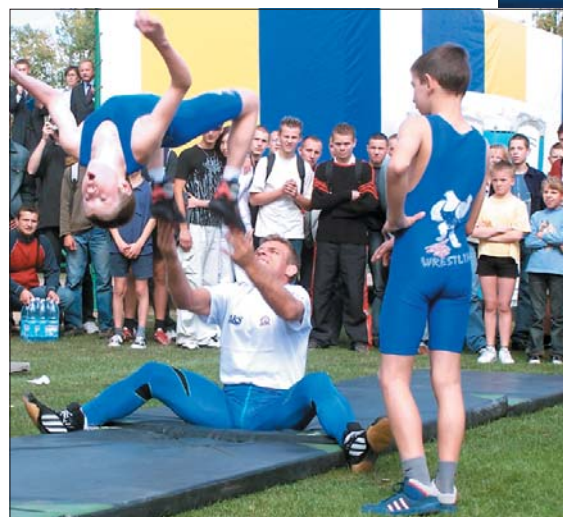
Pokaz umiejętności młodych zapaśników