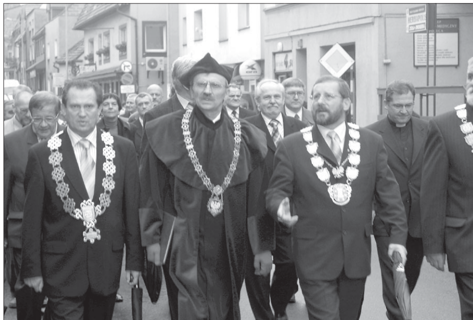
Przemarsz gości z rynku pod muzeum regionalne

Na trąbce odegrano hejnał miasta. Chór „Ave Sol” zaśpiewał „Gaude Mater”. Po ceremonii przed muzeum w pobliskim Liceum