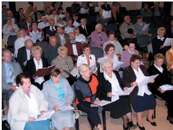
Podczas koncertu z okazji Międzynarodowego Dnia Muzyki w Pleszewie wystąpiły połączone chóry „Harmonia”, „Lira”, „Echo” i zespół z DPS-u.

Koncert w Pleszewie zorganizowało Starostwo Powiatowe. Święto muzyki odbyło się z inicjatywy: Centrum Kultury Zamek w Poznaniu, Wielkopolskiej Biblioteki Publicznej i Centrum Ani-