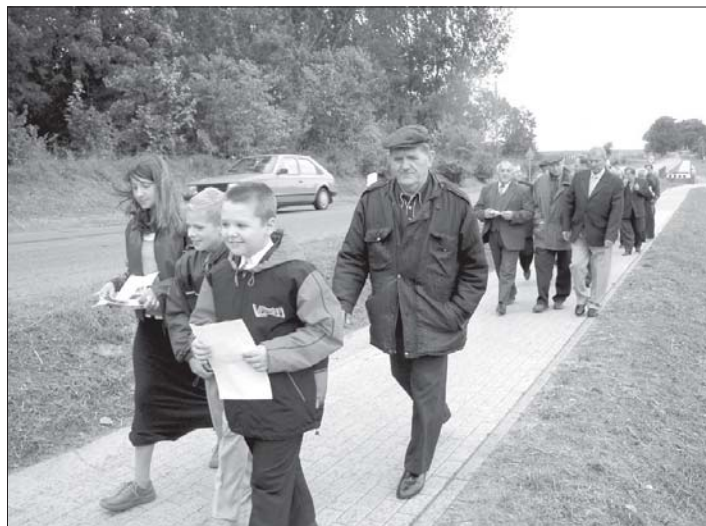
Pierwszy spacer nowym chodnikiem po oficjalnym otwarciu