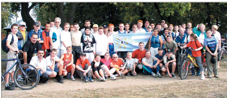
Uczestnicy Rajdu Rowerowego po Ziemi Pleszewskiej