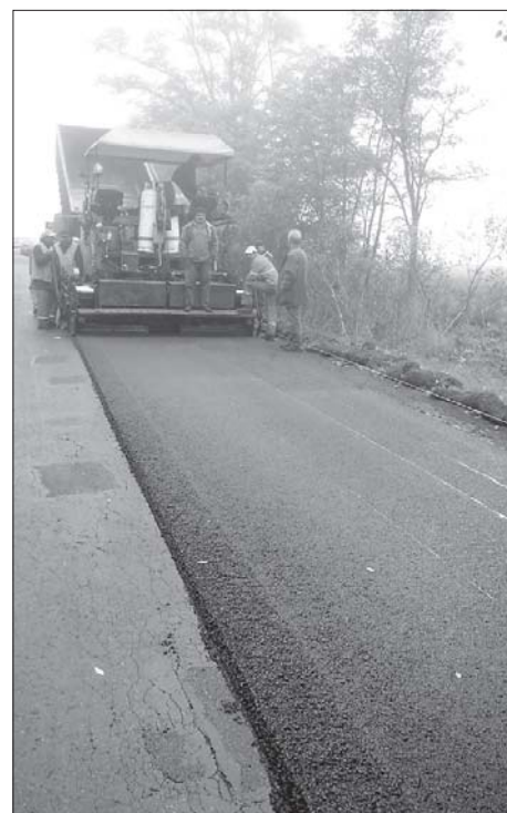
Roboty na drodze Pleszew - Chocz