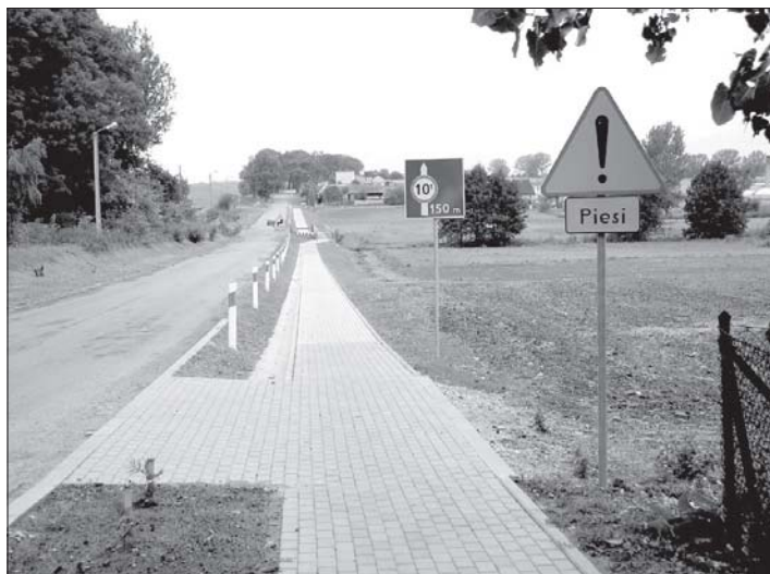
Nowy chodnik ma długość 375 metrów

Fabianów to chyba jedyna miejscowość w Powiecie Pleszewskim, która ma trzy mosty w jednym miejscu: wiadukt kolejki wąskotorowej, most drogowy i nową kładkę dla pieszych.