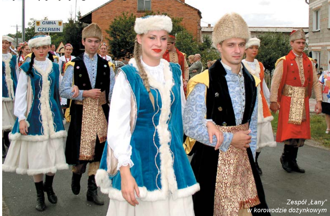
Zespół „Łany” w korowodzie dożynkowym

Tysiące rolników zjechało do gminy Gizaki na Dożynki Powiatowe 2004. W korowodzie szły reprezentacje wszystkich samorządów Ziemi Pleszewskiej. Atrakcji nie zabrakło. Obrzęd żniwny przedstawił Zespół Pieśni i Tańca „Łany” z Akademii Rolniczej w Poznaniu. Były występy, konkursy, wspólna biesiada i zabawa taneczna. Na uroczystości pojawili się posłowie, senatorowie polscy olimpijczycy i goście zagraniczni.