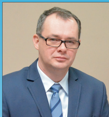
Maciej Wasielewski Starosta Pleszewski

Życzę gimnazjalistom udanego wyboru szkoły, łatwej adaptacji w nowej placówce, sukcesów w nauce, wielu nowych przyjaźni, a za kilka lat dobrych ocen na świadectwie ukończenia szkoły i pomyślnego startu w dorosłe życie. Życzę powodzenia!