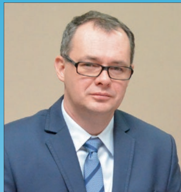
Maciej Wasielewski Starosta Pleszewski

Życzę gimnazjalistom udanego wyboru szkoły, łatwej adaptacji w nowej placówce, sukcesów w nauce, wielu nowych przyjaźni, a za kilka lat dobrych ocen na świadectwie ukończenia szkoły i pomyślnego startu w dorosłe życie. Życzę powodzenia!