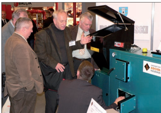
Stoisko Pleszewskiego Klastra Kotlarskiego cieszyło się dużym zainteresowaniem gości targowych