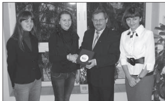
Moment przekazanie zebranych datków przez Starostę Pleszewskiego