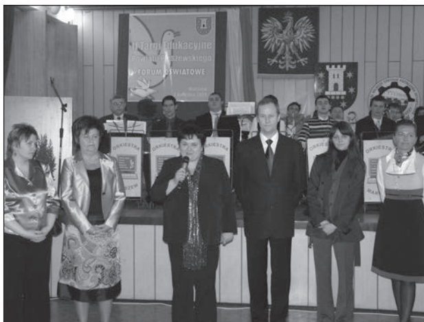
Otwarcie II Pleszewskich Targów Edukacyjnych w szkole rolniczej w Marszewie

Ponad 1.500 gimnazjalistów, ich rodziców oraz nauczycieli odwiedziło II Targi Edukacyjne Powiatu Pleszewskiego, zorganizowane w Zespole Szkół Rolniczym Centrum Kształcenia Ustawicznego w Marszewie.