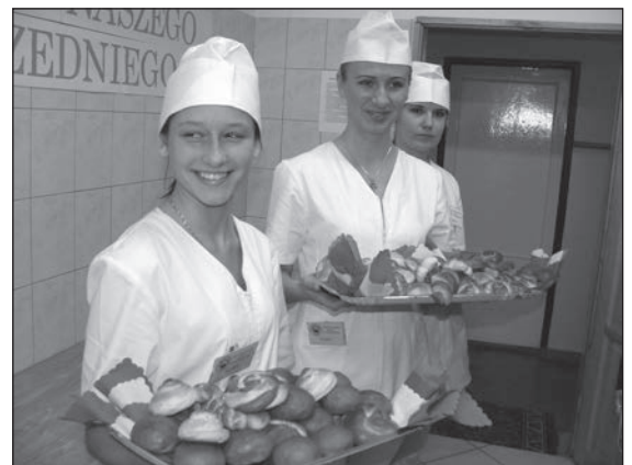
Dzień Technologia Żywności - wypieki z minipiekarni szkolnej