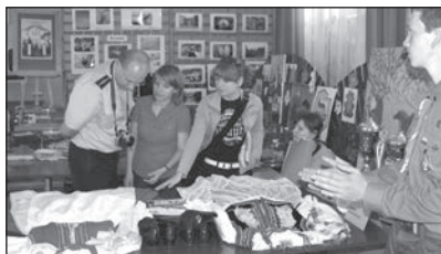
Wystawa „Życie z pasją”

rynku w Pleszewie 21 maja odbył się happening, przygotowany przez ośrodek „Monaru” w Nowolipsku z pomocą uczniów pleszewskich szkół ponadgimnazjalnych. Na koniec aktorzy i wszyscy widzowie stanęli wokół rynku w łańcuchu czystych serc. Nakręcony podczas happeningu klip filmowy będzie promował obchody 30-lecia „Monaru” w całej Polsce.