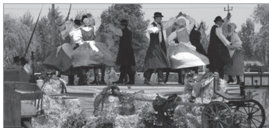
W CZĘŚCI ARTYSTYCZNEJ na scenie wystąpił Regionalny Zespół Pieśni i Tańca „Tursko” z gm. Gołuchów

Inauguracji Dnia Samorządowca dokonali Marszałek Województwa Wielkopolskie-