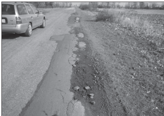
Tak obecnie wygląda droga do Dobrzycy. Zniszczone pobocze w okolicach Fabianowa

Koszt modernizacji drogi Pleszew - Dobrzyca - do granicy z pow. krotoszyńskim wynosi 13,64 mln zł. Z WRPO będzie pochodził