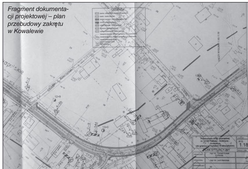
Fragment dokumentacji projektowej – plan przebudowy zakrętu w Kowalewie

Takich pieniędzy z zewnątrz w Powiecie Pleszewskim jeszcze nie było. To wielki sukces Powiatu Pleszewskiego. Jesteśmy na pierwszym miejscu do realizacji. To tak, jak gwarancja na 100%. Teraz przed nami procedura przetargowa. Tak wysoka ocena naszego projektu to efekt ciężkiej pracy i wielu zabiegów. Zawarliśmy porozumienie z kolejną na przebudowę przejazdu w Kowalewie. Mamy uzgodnienia z parafią w Kowalewie i zgodę Biskupa Kaliskiego na przekazanie powiatowi gruntów kościelnych w celu złagodzenia zakrętu w zamian za nowy parkan przy kościele i plebanii. Droga będzie wreszcie taka, jaka być powinna: będą zatoki autobusowe, zjazdy do pól, w miejscowościach przy zwartej zabudowie powstaną nowe chodniki, w samej Dobrzycy zmodernizowane zostanie skrzyżowanie z ul. Jarocińską. Inwestycja powinna się rozpocząć pod koniec 2009 roku lub na początku 2010. Jeśli uda się także realizacja zbiornika wodnego w Lutynii - a wspieram te działania od samego początku, gdy byłem jeszcze dyrektorem Muzeum w Dobrzycy - to w zachodniej części naszego powiatu powstanie zupełnie nowa jakość, nie tylko turystyczna, ale cywilizacyjna.