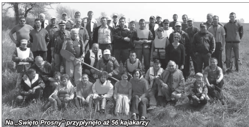
Na „Święto Proсны” przyplłynęło aż 56 kajakarzy

Wielkie otwarcie sezonu wodnego w powiecie pleszewskim pod nazwą „ŚWIĘTO PROSNY” odbyło się 26 kwietnia w Kwileniu k/ Chocza. Na przystani kajakowej spotkali się kajakarze, wędkarze, rowerzyści i miłośnicy turystyki pieszej.