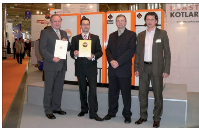
Nominacja do złotego medalu MTP