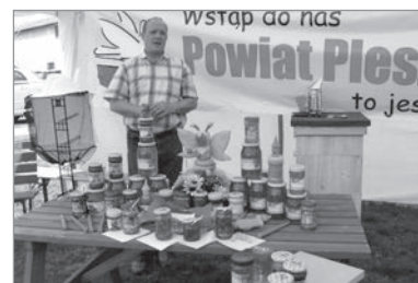
Na terenie ośrodka ustawiono stoiska promocyjne sponsorów, firm i samorządów pleszewskich. Wystawiały się m.in.: Spółdzielnia Ogrodniczo-Pszczelarska (na zdjęciu), Pleszewski Klaster Kotlarski, „Spomasz” Pleszew S.A., firma „Daw-Mag”, firma „Kaczmarek” z Czermi, Okręgowa Spółdzielnia Mleczarska Kowalew-Dobrzyca oraz Pleszewskie Stowarzyszenie Producentów Ogrodniczych „Pomidor Pleszewski”

Uczestnicy zjazdu wzięli udział w szkoleniu pt. „Zarządzanie wizerunkiem gminy”. Potem odbyła się tradycyjna biesiada wielkopolska. Spotkanie trwało do wieczora. (tw)