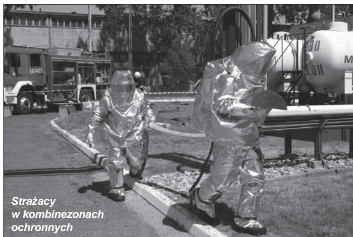
Strażacy w kombinezonach ochronnych

Celem zadania było doskonalenie koordynacji działań ratowniczych i współdziałania powiatowych służb, straży i zespołów reagowania kryzysowego, sprawdzenie praktyczne procedur ostrzegania, alarmowania, powiadamiania o zdarzeniu oraz ewakuacji pracowników