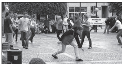
Happening na rynku