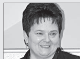
Dorota Czaplicka Wicestarosta