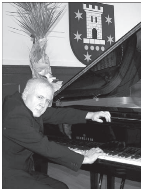
Waldemar Malicki przy fortepianie

Wybitny polski pianista Waldemar Malicki wystąpi 11 listopada w Pleszewie z okazji Święta Niepodległości. Aula pleszewskiego liceum będzie wypełniona po brzegi. Występowi przyszedłoby wysłuchać ponad 400 osób.