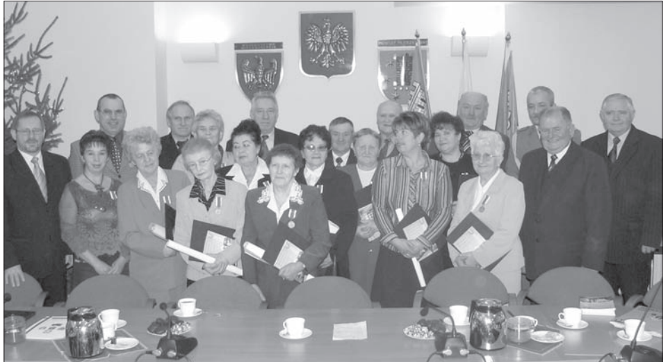
Grupa odznaczonych z gm. Pleszew

Srebrnymi medalami Ministerstwo Obrony Narodowej odznaczyło 67 osób, a siedmioro rodziców, którzy wychowali aż pięciu lub sześciu synów – żołnierzy, otrzymało złote