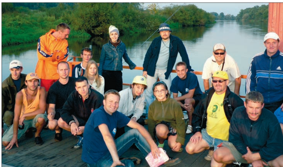
Pamiętnikowe zdjęcie uczestników maratonu