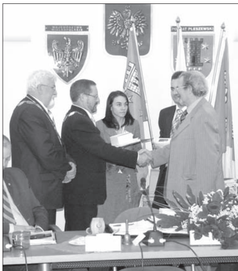
Każdy z radnych II kadencji otrzymał pisemne podziękowanie