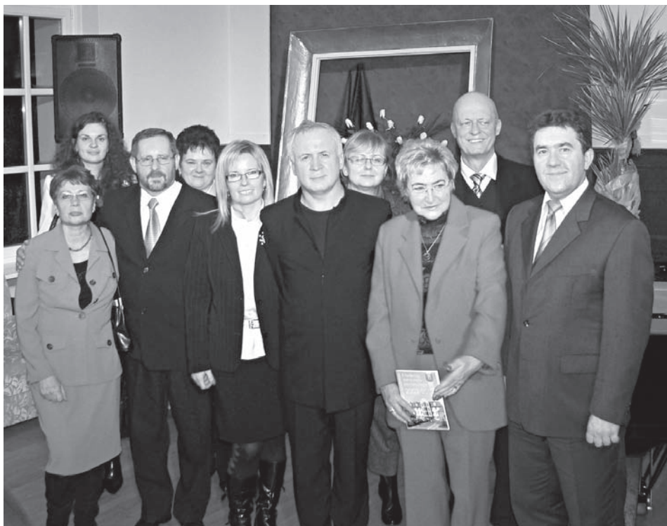
Pamiętamy zdjęcie artysty i organizatorów koncertu

Obchody Dnia Niepodległości w Pleszewie rozpoczęły się już przed południem. Mieszkańcy modlili się za Ojczyznę podczas mszy św. w kościele pw. Oświecenia św. Jana Chrzyciela. Po nabożeństwie delegacje władz powiatu, miasta, organizacji kombatanckich, społecznych i politycznych złożyły wiązanki kwiatów w Miejscach Pamięci Narodowej: pod kościelnym epitafium poległych w Powstaniu Wielkopolskim, na grobie ks. Kazimierza Niesiołowskiego oraz pod tablicą Marszałka Józefa Piłsudskiego w Kowalewie.