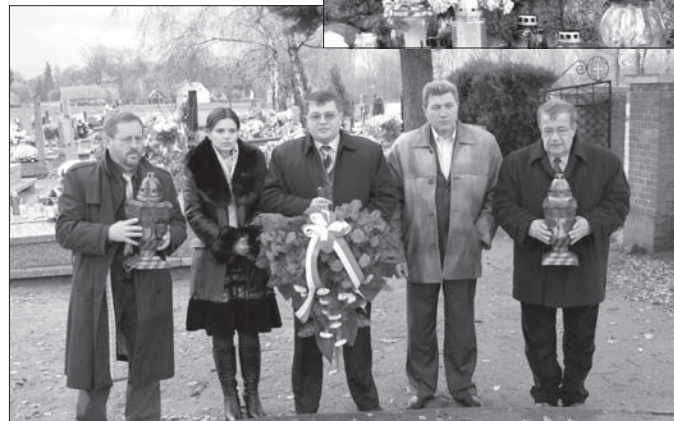
Ukraińska delegacja została kwiaty pod pomnikiem ofiar ukraińskiego nacjonalizmu w Sołocy

Dzień wcześniej 8 listopada goście z Ukrainy uczestniczyli w obchodach 15-lecia chóru „Ave Sol” w pleszewskim liceum. W czwartek rano pojechali do Sołocy na cmentarz. Potem zwiedzali Przedsiębiorstwo Komunalne w Pleszewie i oczyszczalnię ścieków w Zielonej 1 ce. Odwiedzili też gminę Gołuchów. (tw)